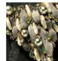
Une création de Gilbert Albert.