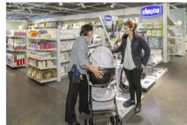
Au Micasa du Mparc La Praille, les mamans peuvent bénéficier de conseils et services sur mesure.